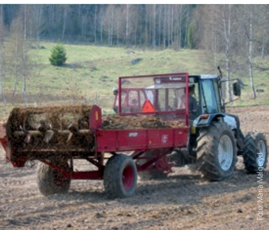
Kombivagn med bottenmatta och en liggande vals.