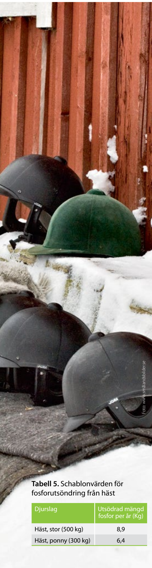
Tabell 5. Schablonvärden för fosforutsöndring från häst