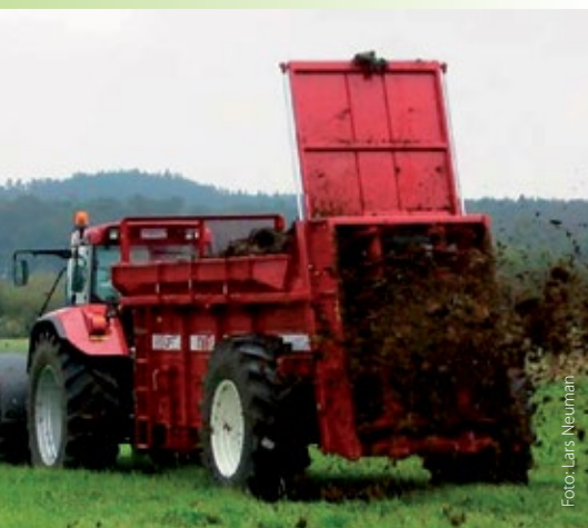
Fastgödselspridare med bottenmatta och två stående valsar.