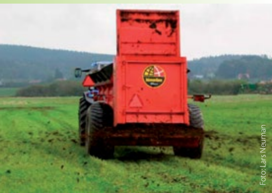
Tvåstegspridare med liggande valsar och roterande tallrikar.